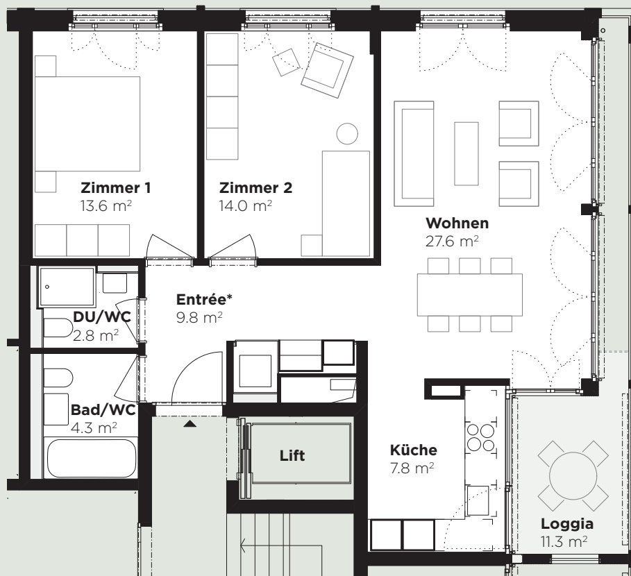
Abbildung: 2. Obergeschoss, Wohnung 86.212

* Leichte Abweichung der Raumfläche (Entrée) je nach Stockwerk.