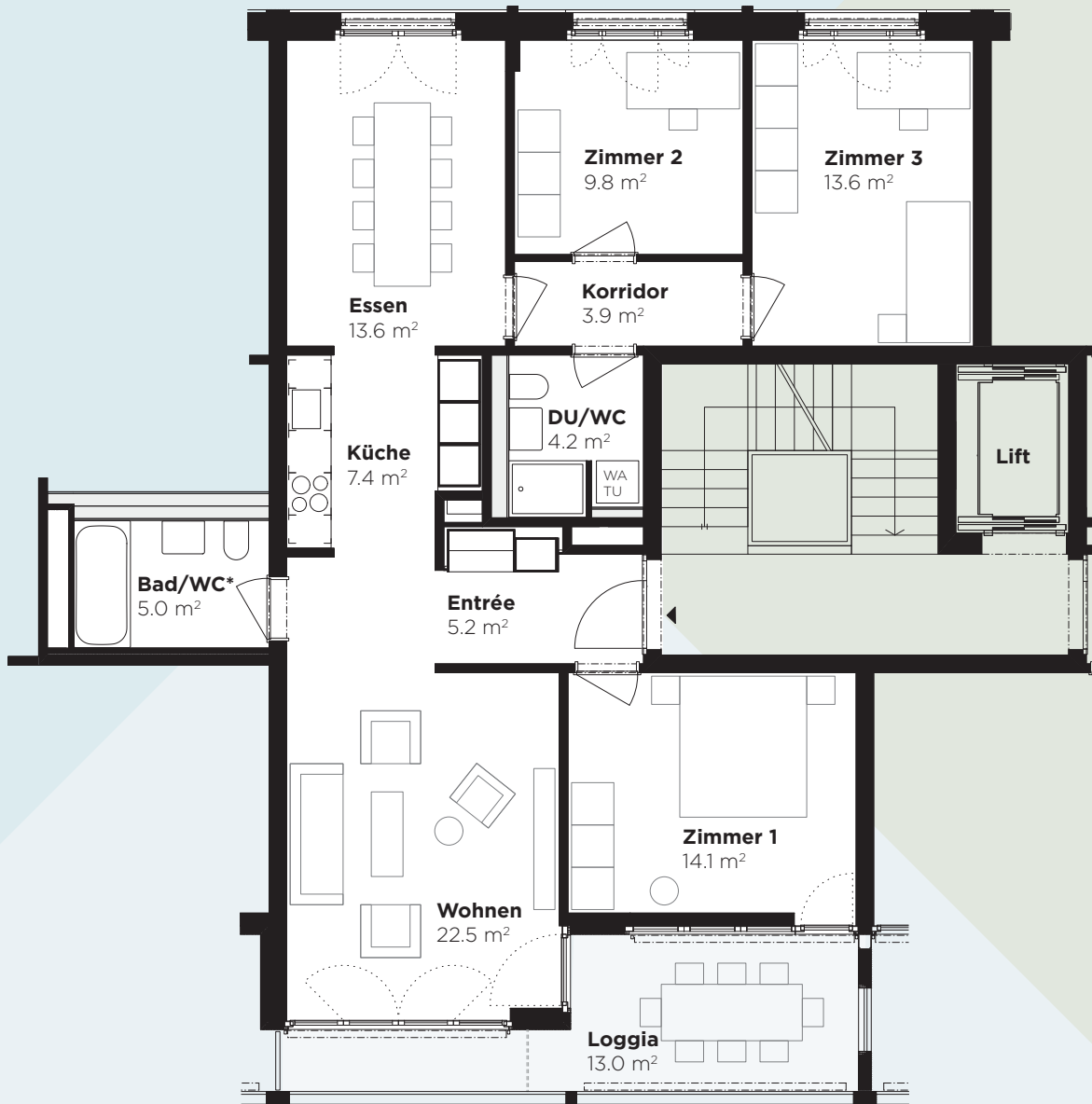
Abbildung: 2. Obergeschoss, Wohnung 84.211

* Leichte Abweichung der Raumfläche (Bad/WC) je nach Stockwerk.