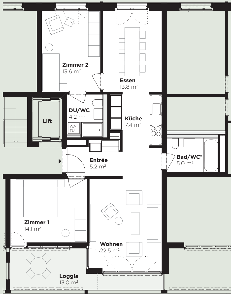
Abbildung: 2. Obergeschoss, Wohnung 84.210

* Leichte Abweichung der Raumfläche (Bad/WC) je nach Stockwerk.