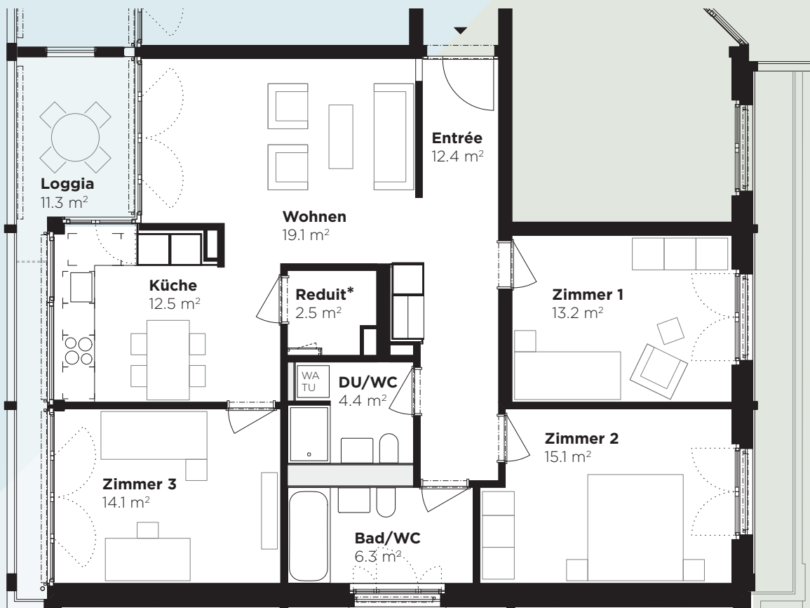
Abbildung: 2. Obergeschoss, Wohnung 80.205

* Leichte Abweichung der Raumfläche (Reduit) je nach Stockwerk.