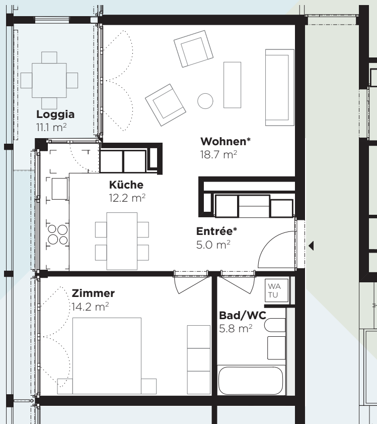
Abbildung: 2. Obergeschoss, Wohnung 80.201

* Leichte Abweichung der Raumfläche (Entrée/Wohnen) je nach Stockwerk.